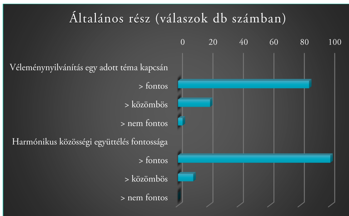
1. ábra: Általános rész – diagram

A megkérdezettek közel 80% fontosnak tartja, hogy kifejezhesse véleményét egy-egy téma kapcsán valamilyen formában, ami a város életét érinti. Közel 92% fontosnak tartja a harmonikus közösségi/városi együttélés megvalósítását/megvalósulását Lébényben.