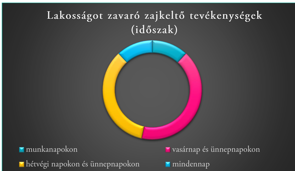
3. ábra: Lakosságot zavaró zajkeltő tevékenységek - diagram

A harmonikus együttélés szabályozásával kapcsolatban a zajkeltőtevékenység, a közutak, közkifolyók, illegális személtlerakás, és annak büntetése, a járdák közterületek, valamint a saját lakókörnyezet és annak takarítása és szabályozásai kérdések kerültek előtérbe a középső szakaszban. A következő diagram ennek összefoglaló eredményeit mutatja be.