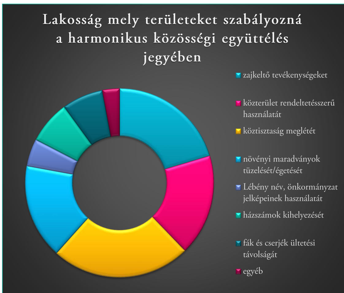
2. ábra: A harmonikus együttélésért - diagram

A köztisztaság meglétét a kitöltők 67,5%-a, a zajkeltő tevékenységeket 57,5%, a közterület rendeltetésszerű használatát 49,2%, a növényi maradványok tüzelését/égetését 45,8% szabályoznák. Az egyéb csoportra érkezett válaszok legtöbbje besorolható valamely fentebb felsorolt kategóriába.