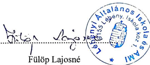
Fülöp Lajosné intézményvezető